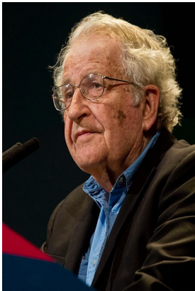
Avram Noam Chomsky